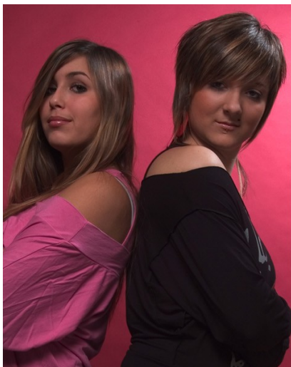
Séance studio 2004

Notre objectif : développer votre créativité photographique, votre regard sur le monde qui vous entoure, créer des images que vous aurez envie de montrer, confronter votre regard photographique à celui d'autres photographes, amateurs, professionnels ou passionnés.