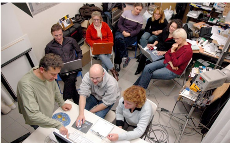
Atelier traitement numérique de l'image.