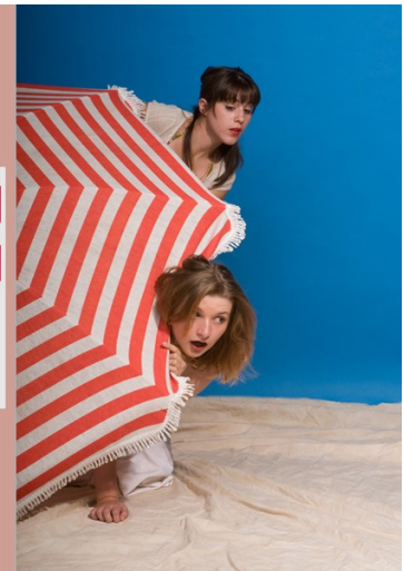
Séance studio 2008

Notre programme : fondé avant tout sur la pratique. Les réglages du matériel photo la composition de l'image, les techniques de prise de vue, l'utilisation du matériel de studio, le traitement de l'image numérique, séances de studio avec participation de modèles, des sorties et expositions pour exercer sa créativité et échanger les idées et les bons plans, les rencontres avec des photographes professionnels, les expositions organisées par les membres de bleuvertrouge.com . Voir le programme détaillé joint.